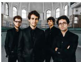
Vision String Quartet 1 er Prix quatuor 2016