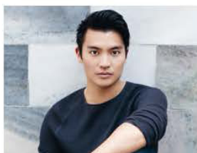
Ray Chen, violon 1 er Prix Concours Reine Élisabeth de Bruxelles 2009