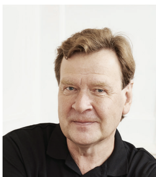
Magnus Lindberg, Allemagne